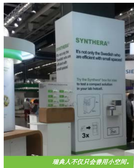
瑞典人不仅只会善用小空间。

在该展示会期间, IBA 展示了建立 PET 中心的各个阶段。参观者有机会参观全球放射性化学参照物现场合成: Synthera®。