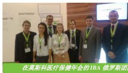
在莫斯科医疗保健年会的 IBA 俄罗斯团队

Synthera®是医疗保健年会中的明星。IBA 俄罗斯团队展示了 IBA 的放射药物解决方案。